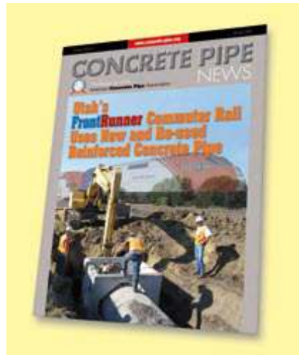
Amerikan Beton Boru Dergisi 27 yıllık boruları yeni bir projeye nasıl yeniden kullandıklarını göstermiştir