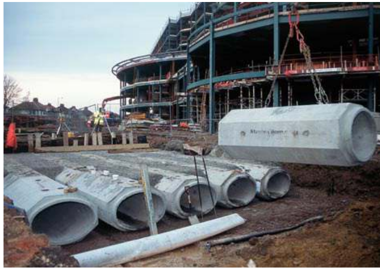
Eliptik taşkın azaltma depoları (Rugby Stadi)