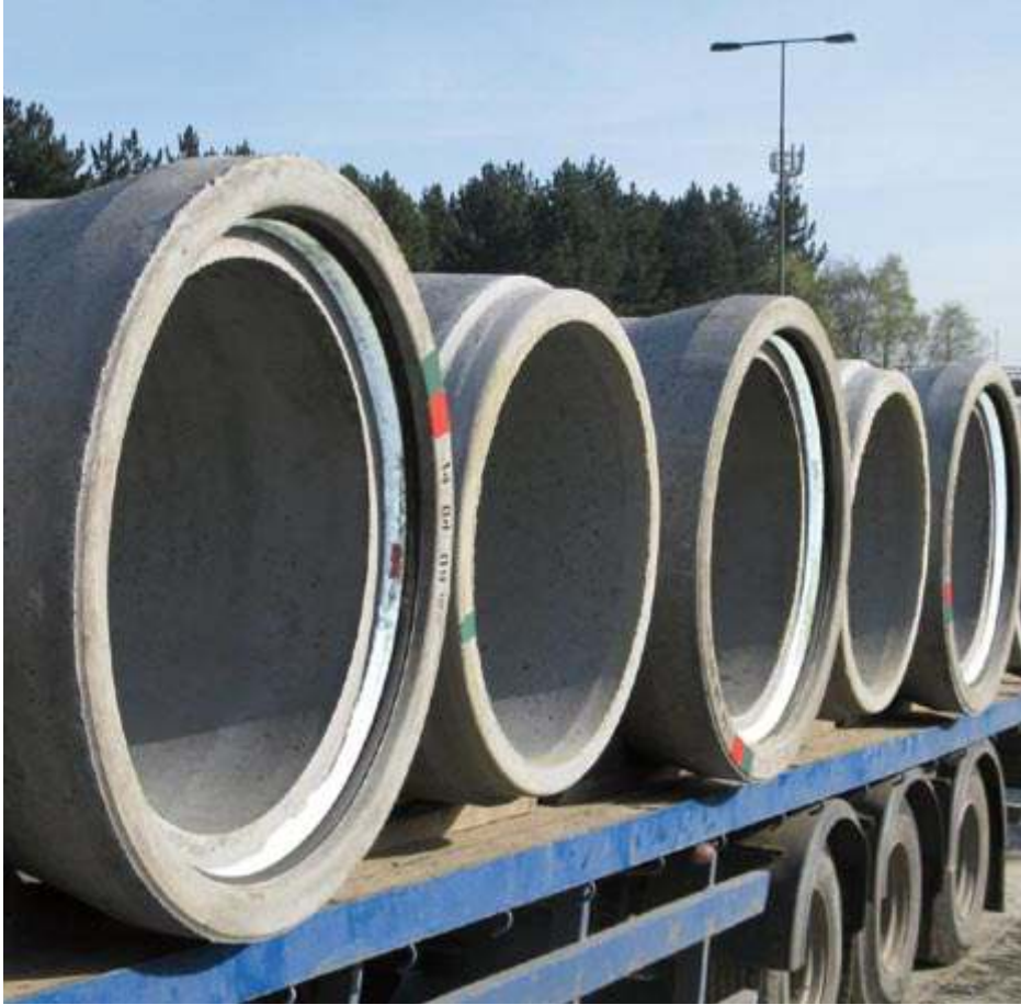
Entegre contalı boru sistemleri