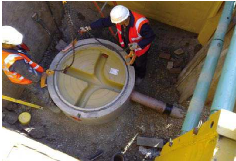
Prefabrik baca tabanları su sızdırmazdır ve zaman kazandırır