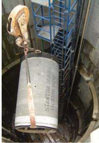
Mikro tünel sistemi (Boru sürme yöntemi) zemini bozmayan ve çevreye az veren mükemmel bir yöntemdir