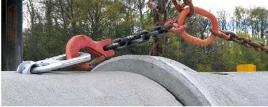
Özel tasarlanmış zincirler ve çapalar