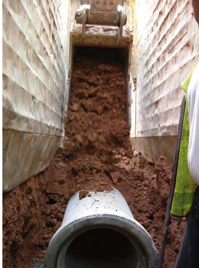
Borular kurulum aşamasında ve yıllar sonra da yer değiştirmezler