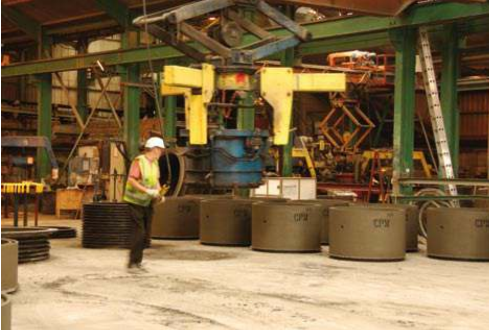
Beton boru hatlarının kalitesi üretim aşamasındaki kaliteyle sağlanır