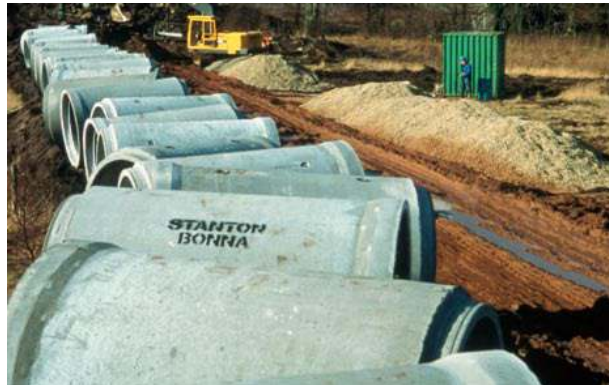
Beton borular inşaat sahasında özel bir koruma gerektirmez