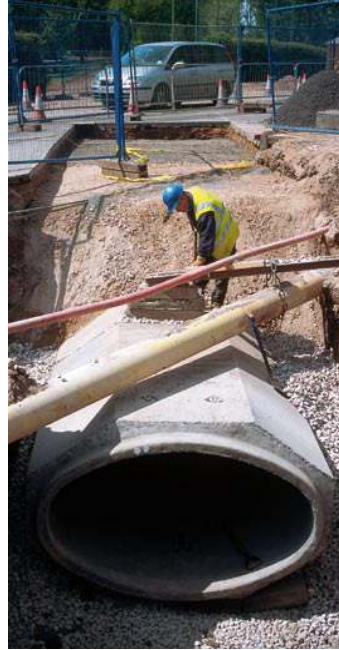
Eliptik boru; çok az kazı derinliğinde doğalgaz borusu altında