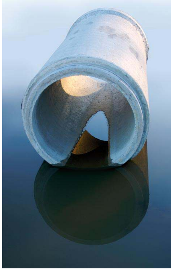
Beton borular çevreye zararlı kimyasalları salmazlar