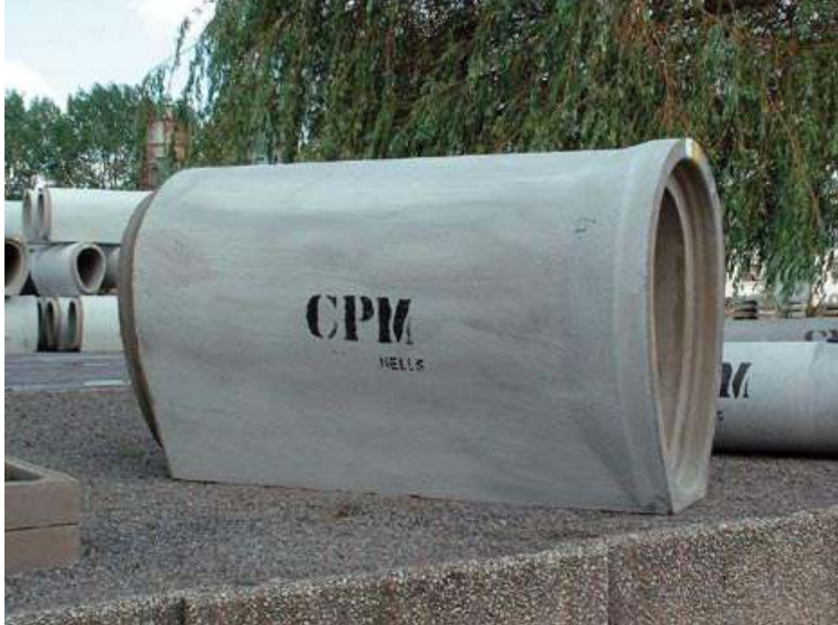
Özel şekilli borular hidrolik verimliliği arttırabilir