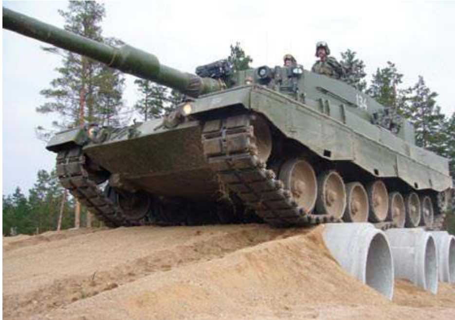
Beton borular çok büyük yükler altında dahi dirençlidir